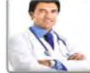
Un médecin طبيب